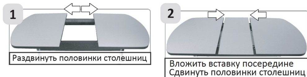
Схема раскладки столешницы раздвижного стола